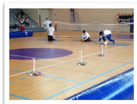
compétition de torball